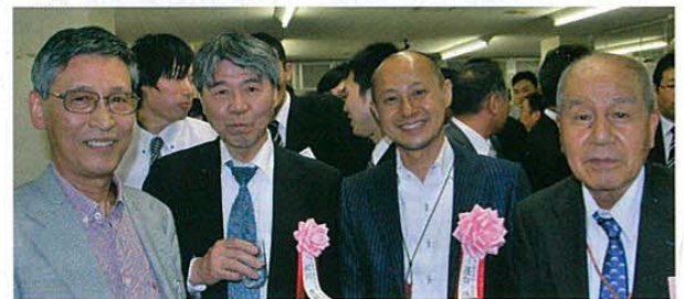
蓬台社長と記念撮影