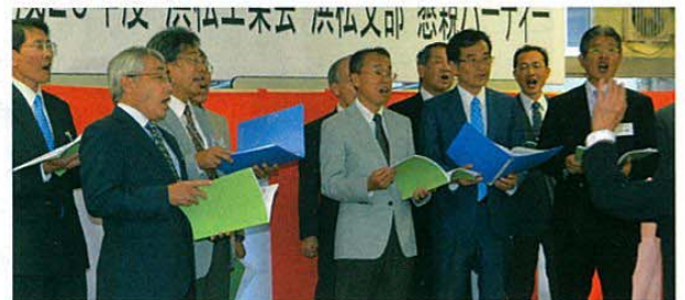
趣味の会へ新加入した「佐鳴グリーンクラブ」の合唱披露