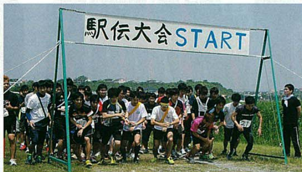
気合いを入れて一斉にダッシュ

1チーム23人で3チームとなると69人必要です。特に浜松支部チームは23人のところ19人しか集まっていませんでした。そこで、1人が2区間を走ることができる大会の特別ルールを利用し、何とか3チーム参加の見通しを立てることができました。