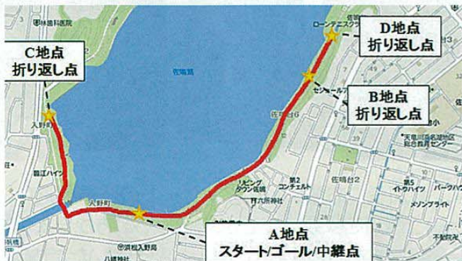
駅伝大会の結果 (29チームが参加)