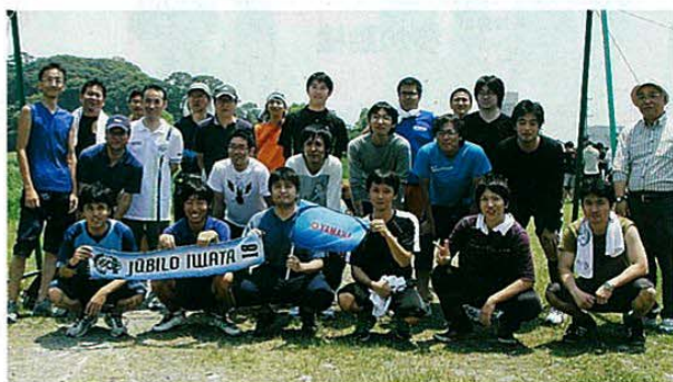
ヤマハ発動機チーム