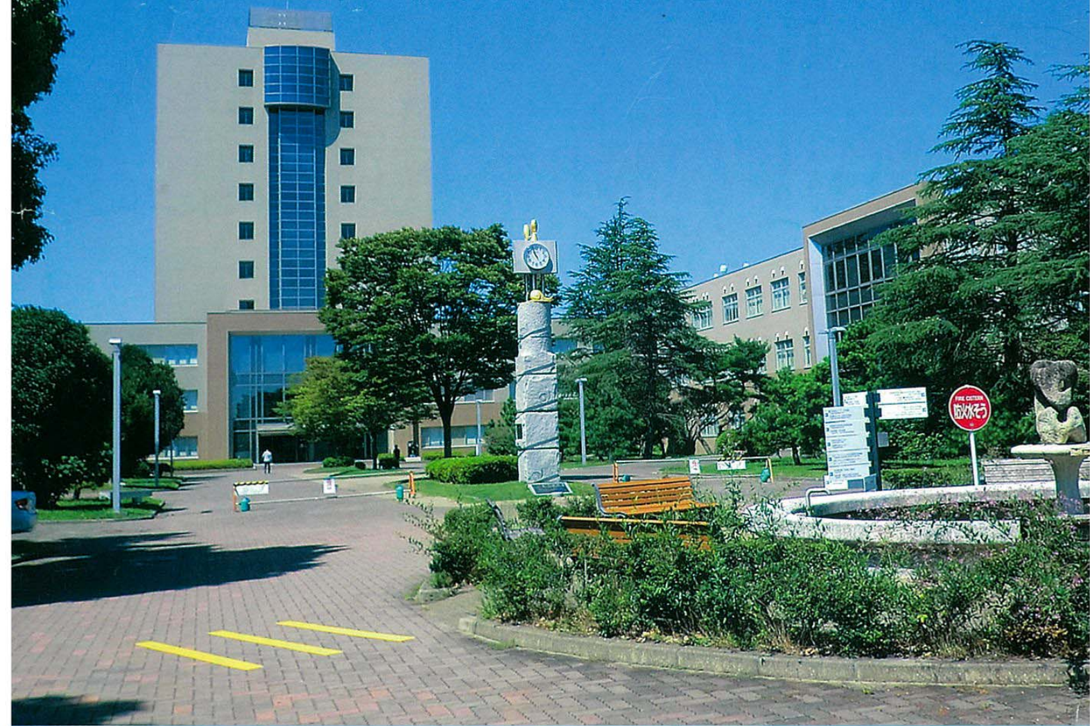
附属図書館分館・学生支援棟