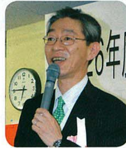
高松附属図書館長