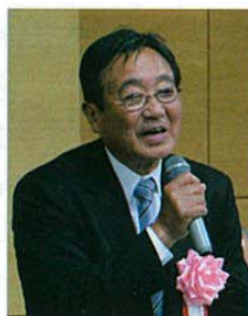
大須賀浜松工業会会長

浜松キャンパスでの開催は斬新なアイデアですが準備は大変でした。総会前日から常任幹事や企業幹事の皆さんにも会場設営に協力していただきました。ここでも同窓の絆を深めることができたと思います。