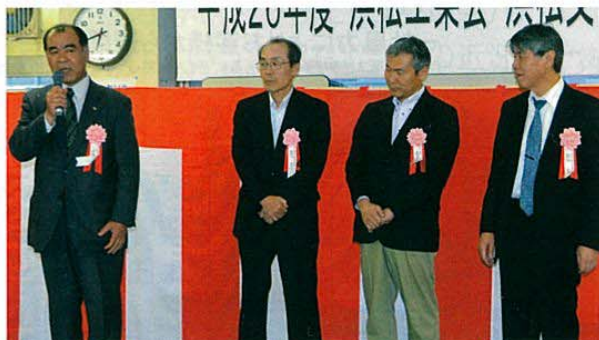
静岡、愛知、東京、阪奈和の各支部長より近況報告