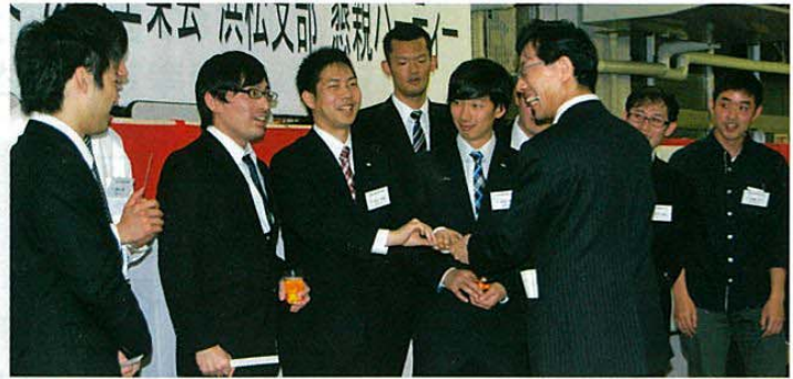
20歳代の皆さんにはくじ引きでプレゼントも