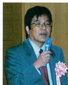
佐古工学研究科長