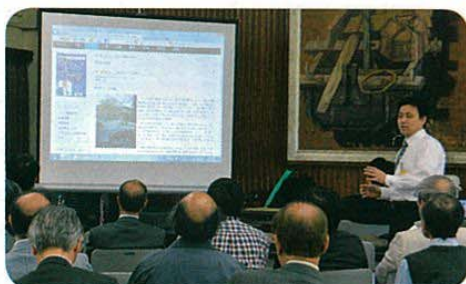
ホームページの紹介