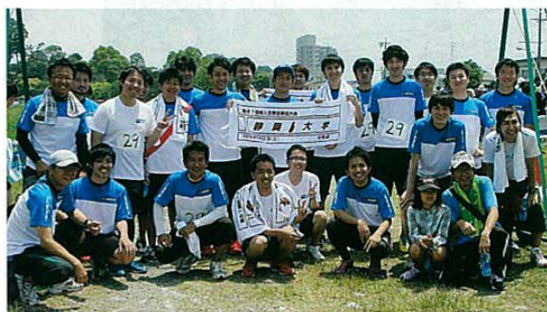
スズキ佐鳴会チーム

当日は浜松支部から参加したスズキ佐鳴会チーム、ヤマハ発動機チーム、浜松支部チームの3チームが健闘し、怪我をすることなく全チーム無事完走することができました。ゴール後は、みんなそろって写真を撮り、達成感を味わいました。参加企業には、賞品を提供していただいた企業もあり、今年も、閉会式で配られ、学生の皆さんが喜んでいました。最後に今回このイベントに参加していただいた皆さん、おかげ様で浜松支部として3チーム参加が実現できました。そして無事完走できました。来年も是非参加いただき、大会を盛り上げましょう。