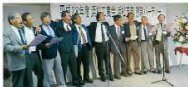
声高らかに思いも一つ