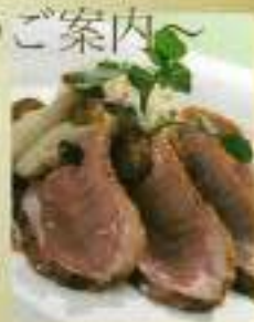
浜松工業会 事業委員会