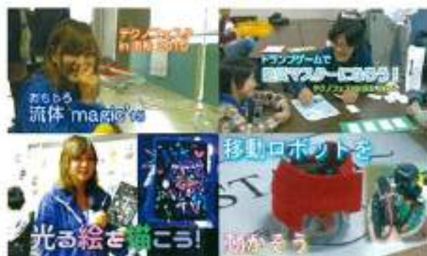
昨年のテクノフェスタの様子

http://www.shizuoka.ac.jp/festa/h_about_2016.html