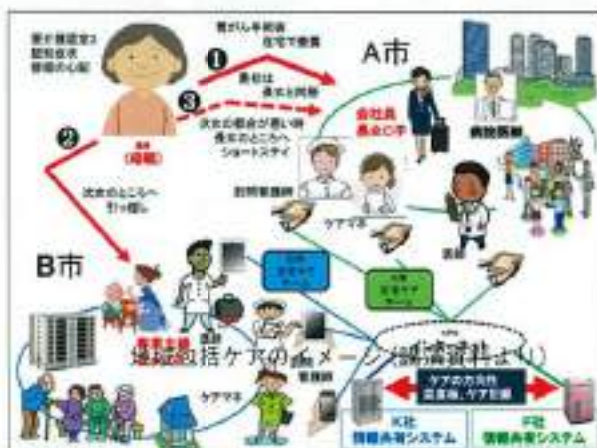
地域包括ケアのイメージ(講演資料より)

記事の詳細はホームページで紹介します。 http://senaruhama.org