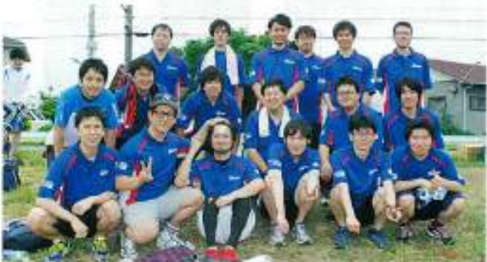
スズキ佐鳴会チーム