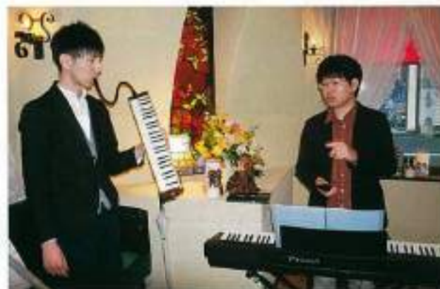
雰囲気を盛り上げた演ジャズ奏