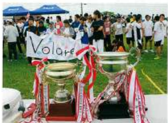
今年で89回を迎えた大会 年々国際色も豊かに