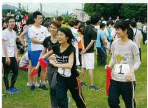
学生チームの華やかさも年々増えています