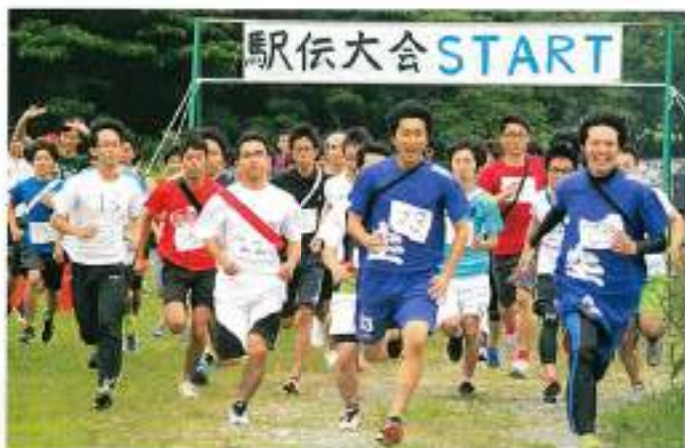
ヨーイ ドン! チームワークでたすきをつなぐ

混成チームに協力いただいたのは、ヤマハ、 NECプラットフォームズ、日星電気、浜松支部 執行部のみなさんでした。