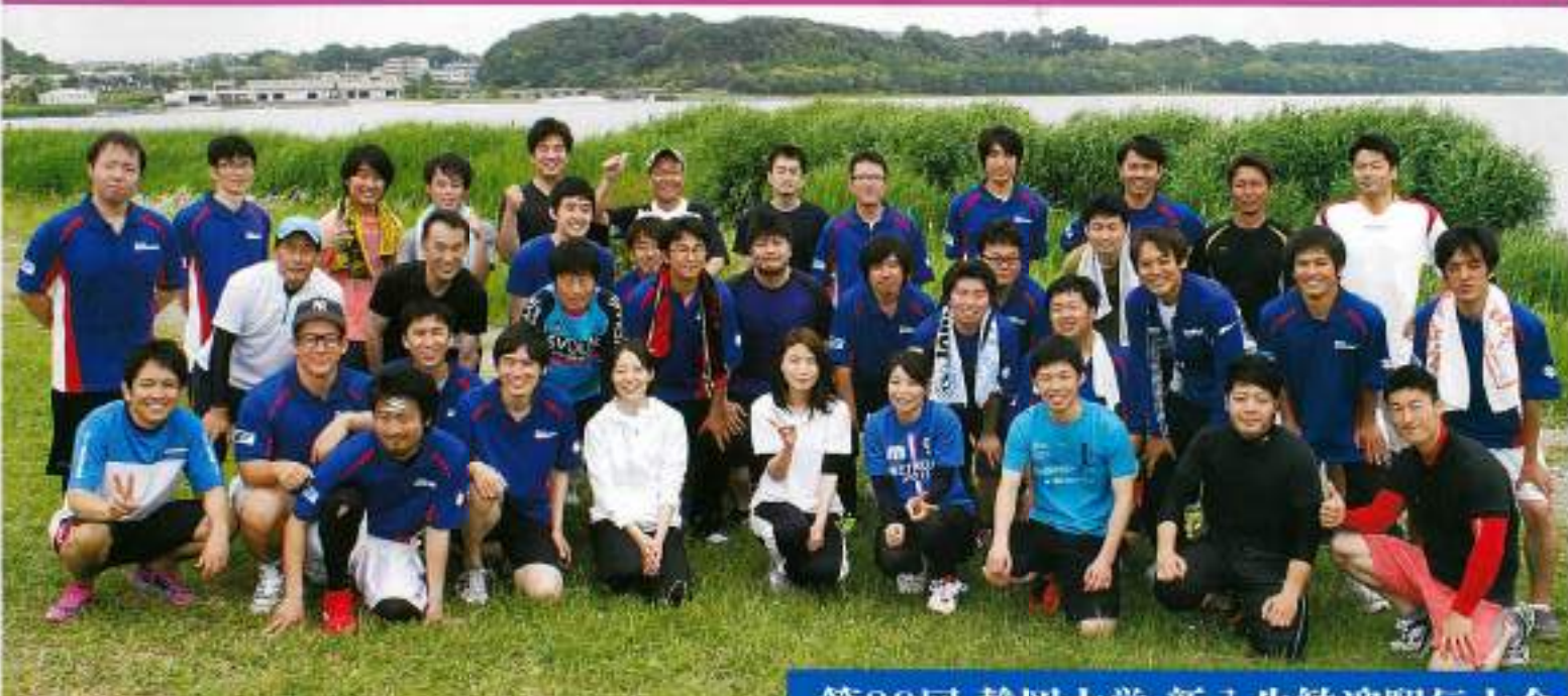
第89回 静岡大学 新入生歓迎駅伝大会