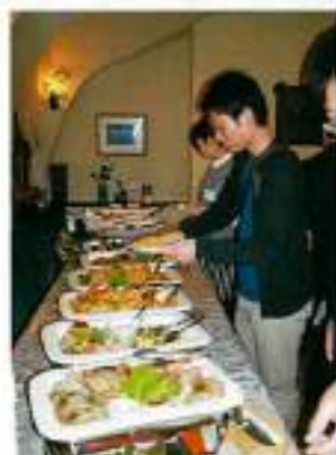
ワインに合う料理は？