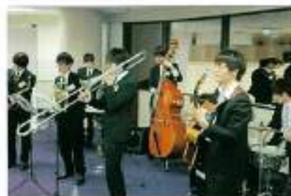
現役生によるジャズ演奏