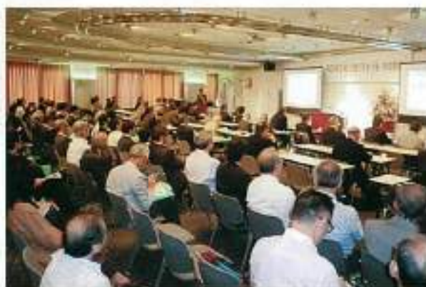
会場は多くの聴講者で埋まりました。

まさに時代の先端を行く研究や開発に関する話題満載で、非常に興味深いお話でした。紙面の都合ですべてを紹介できないのが残念ですが、「データ活用」「AIとの共存に向けた研究」の重要性を危機感とともに痛感させられました。講演中に出てきた「ナッジ理論」も興味深かったです。