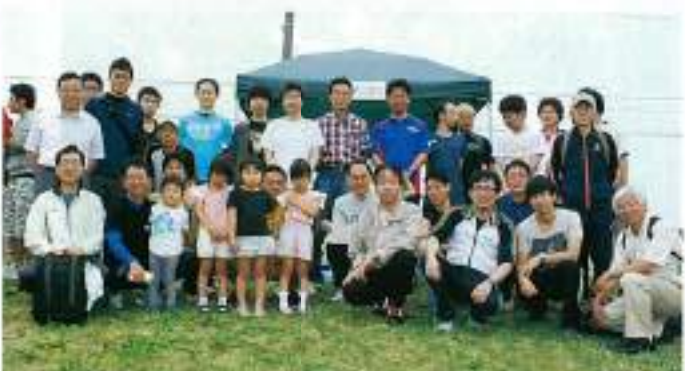
浜松支部混成チーム