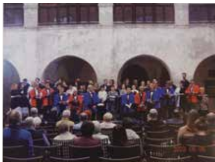
スロベニア・クロアチア演奏旅行