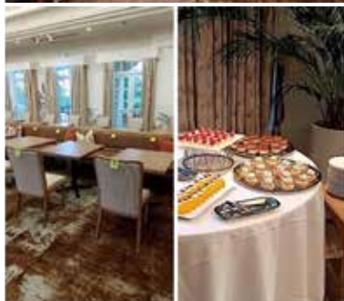
婚活サマーパーティー会場の様子

台風7号接近の最中、浜松北高校の結婚相談室とのコラボ活動開始1周年を記念し、英国教会風の結婚式場・アビーチャーチにて婚活サマーパーティーを開催しました。