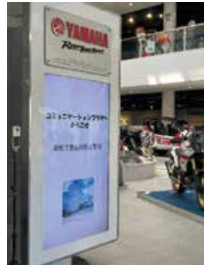
コミュニケーションプラザへようこそ

ヤマハ発動機創業当時から今に至る約70年の、バイクを始めとした陸・海・空で活躍する製品や技術、企業活動の歴史をつづる展示。