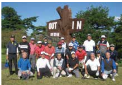
合同コンペ 2022/10/16 於 浜松カントリークラブ