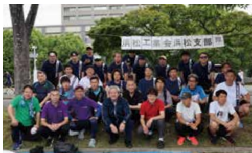
駅伝参加者と記念撮影