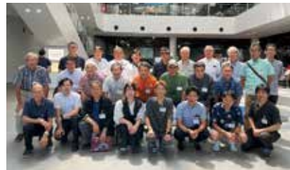
参加者と記念撮影