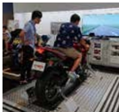
ライドシミュレーター