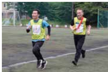
絶好の駅伝日和。みんな一生懸命走っています