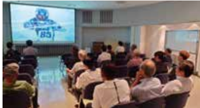
視聴する参加者たち

浜松駅からバスで移動し、ヤマハ発動機コミュニケーションプラザの会議室で社内案内ビデオを視聴した後、展示エリアを見学しました。