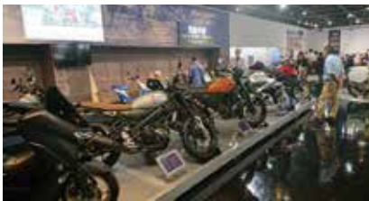
ズラリと並んだバイク