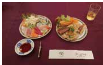
おいしい料理を沢山頂きました